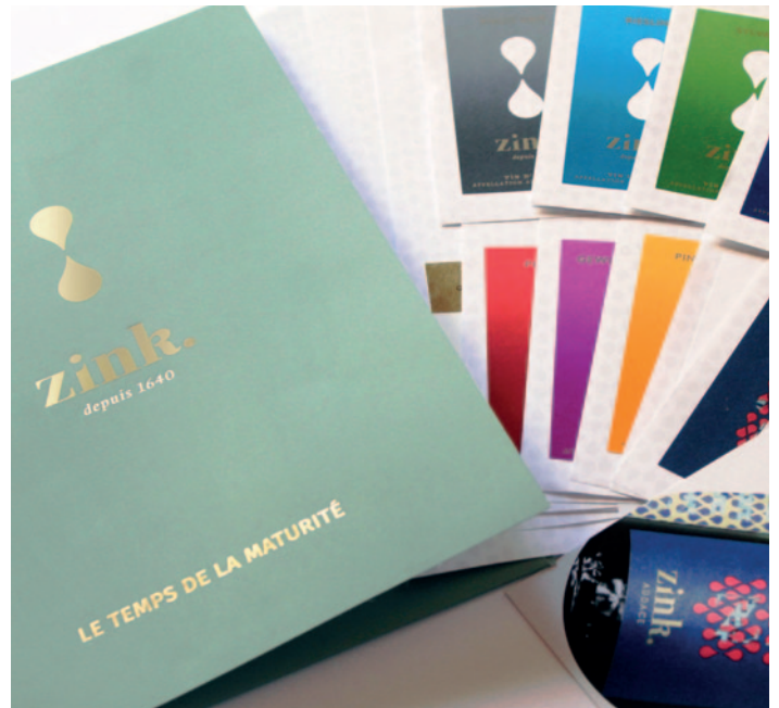
Une plaquette premium et créative pour la prospection d'une nouvelle cible professionnelle exigeante