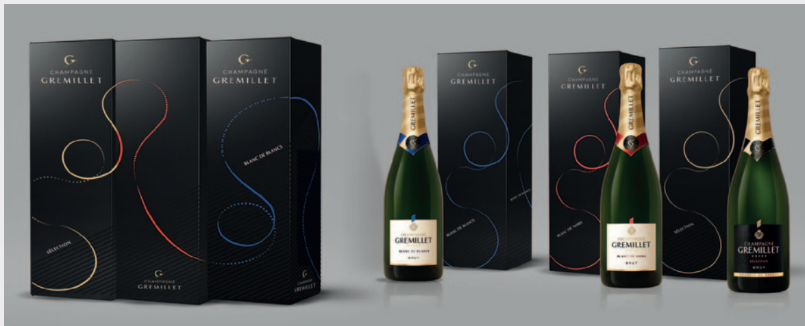
Une création du «chemin de vie» qui peut s'exprimer sur 1, 2 ou 3 étuis en fonction des linéaires disponibles !

Dans des linéaires saturés, se démarquer de la concurrence, maximiser sa visibilité est un vrai enjeu pour toutes les marques. C'est dans cette optique, et voyant là une vraie opportunité de déployer pleinement le concept de « Chemin de vie » si cher à la maison Gremillet que nous avons développé ces trois étuis modulables. Un vrai jeu s'installe pour mettre en scène le «Chemin de vie», sur 1, 2 ou 3 étuis !