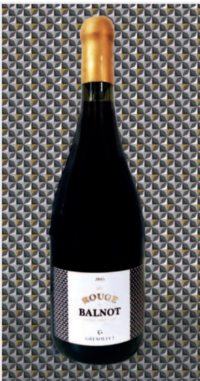
Un packaging rappelant les codes de la bistronomie française

Pour coiffer le tout, une cire dorée fait écho au travail de l'étiquette pour dépoussiérer habilement cette bouteille.